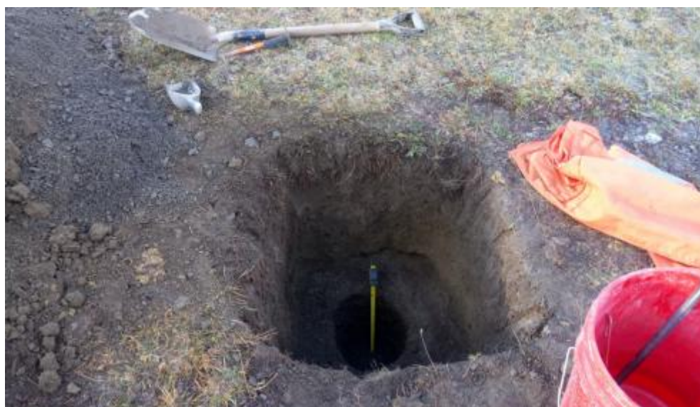
Figura 3. Vista general de calicata realizada en el sector 1

En el sector 1, se presenta una pendiente plano a plana ondulada 1 ; El sector 2, pendientes de ondulada a cerrano-montano 1