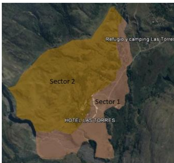
Figura 2. Visualización de los dos sectores estudiados

Sector 2: zona aledaña al hotel Las Torres, dirección Este , Pendientes onduladas a cerranas, con bosque de Nothofagus spp y matorral preandino.